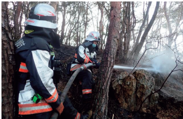
令和3年2月栃木県足利市で発生した林野火災