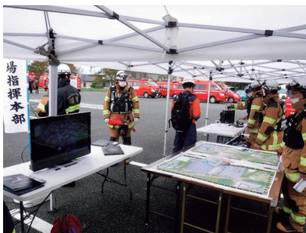
避難指示区域内における大規模火災対応訓練 におけるドローン映像を活用した指揮活動