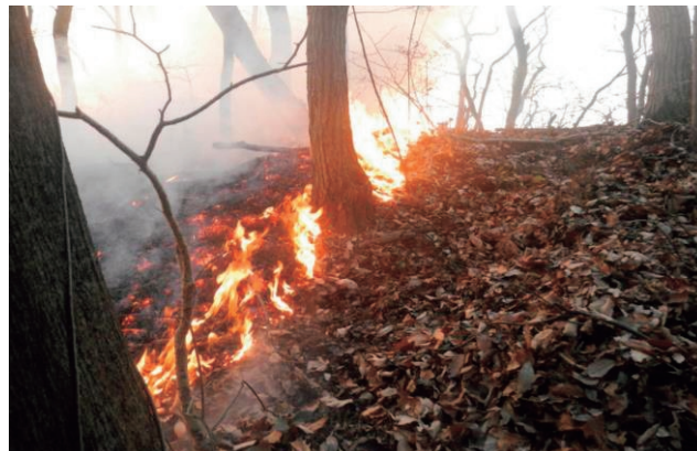
令和3年2月栃木県足利市で発生した林野火災