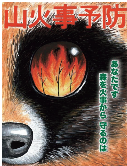
山火事予防ポスター

さらに、平成30年から、林野火災の優良な予防対策の事例や実災害から得られた知見等を広めることを目的に、都道府県林野関係部局や消防本部等を対象とした「林野火災対策説明会」を開催している。